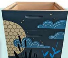
Ruches, par Mailys et Coraline Rivière.

404A, VIEUX CHEMIN DE BINCHE, 7000 MONS. TABLEETCHAMBREPARTICULIERE.BE.