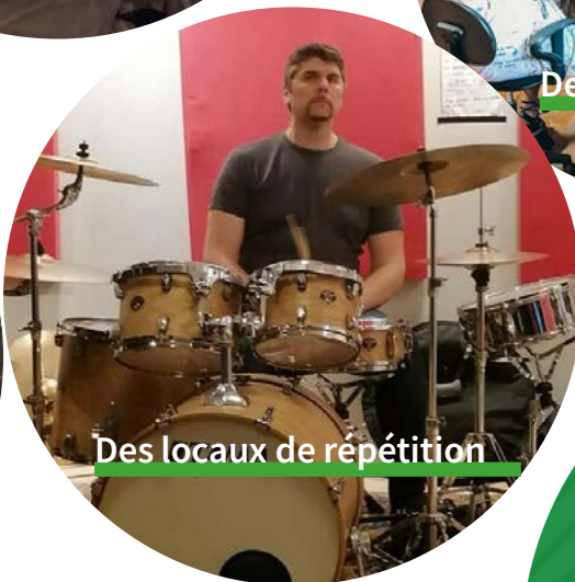
Des locaux de répétition