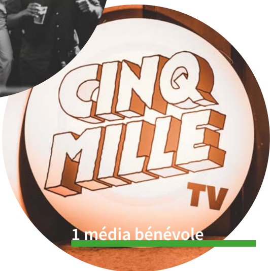
1 média bénévole