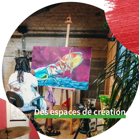
Des espaces de création