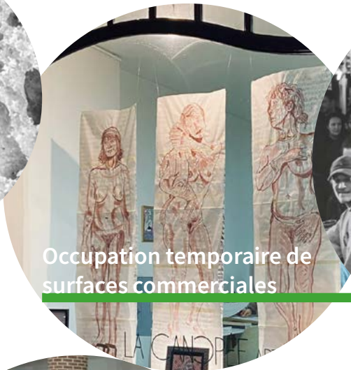
Occupation temporaire de surfaces commerciales