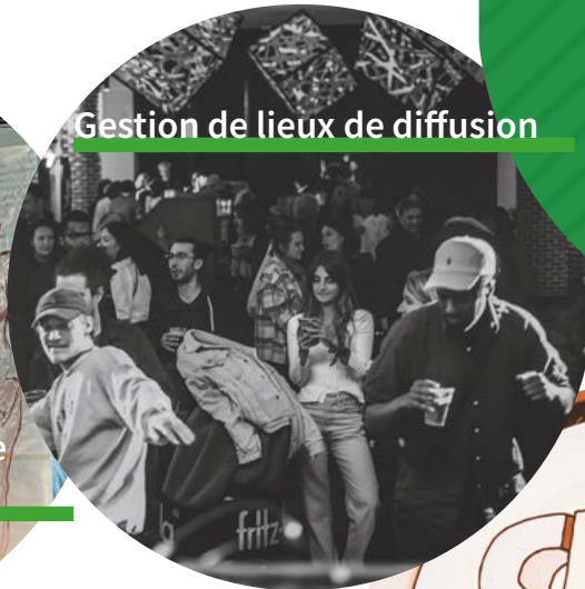
Gestion de lieux de diffusion